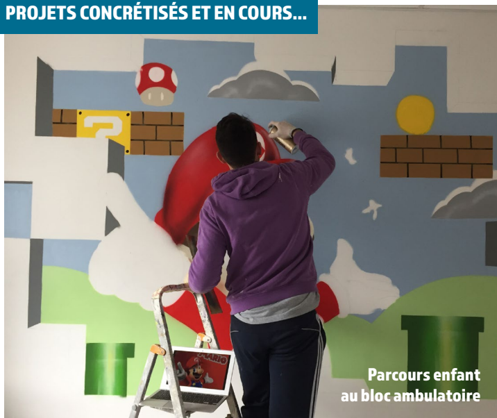
Parcours enfant au bloc ambulatoire