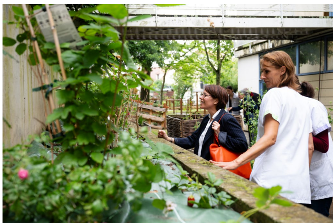
Inauguration du jardin de soins & santé du Pôle de Gériatrie du CH d'Arpajon (21 juin 2024)

En 2025, pour aller plus loin, nous avons besoin de vous !