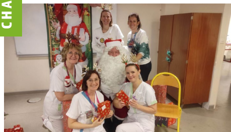
Spectacle pour les enfants hospitalisés

Le fonds a co-financé la journée spéciale proposée par l'équipe de Pédiatrie aux enfants hospitalisés à l'occasion des fêtes de fin d'année. Cette journée a été marquée par le passage du Père Noël, un repas festif et par un spectacle de cirque.