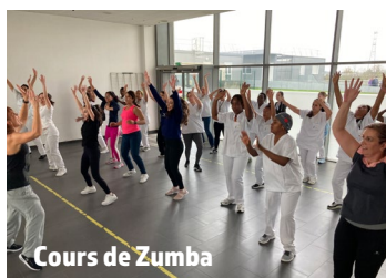
Cours de Zumba