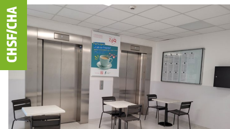
Une pause pour les hospitaliers

Le fonds a co-financé le « Café de l'hôpital », une pause encourageant les échanges entre professionnels de l'hôpital.